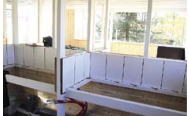
Kesäkeittiöllä laatoitus kesken