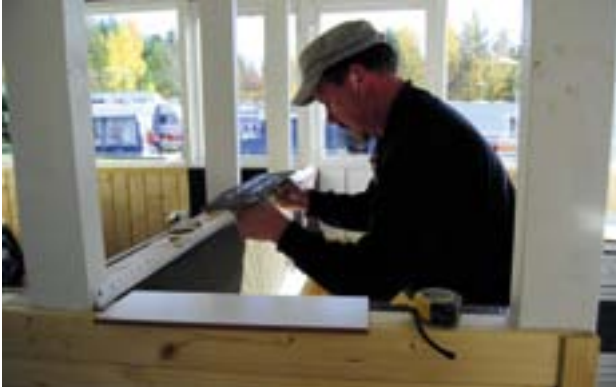
Tarkkaa puuhaa ammattimiehellä